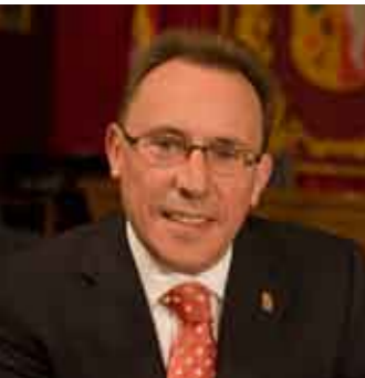
Jordi Romeu Llorach Alcalde de Vinaròs Alcalde de Vinaròs

El Concurs Nacional de Cuina Aplicada al Llagostí de Vinaròs, tal i com es ve desenvolupant des de l'any 2003, recupera les antigues essències d'aquest esdeveniment que va deixar de realitzar-se en la dècada dels anys 70 del passat segle, i que tracta d'incentivar noves tendències culinàries a Vinaròs.